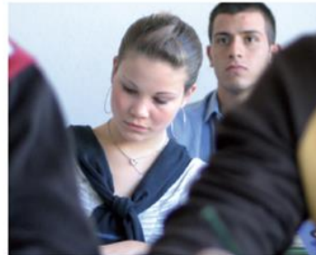
MSA Der mittlere Schulabschluss 2009